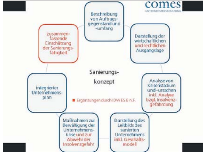
Abbildung 1: Kernbestandteile eines Sanierungskonzepts nach IDW ES 6 n.F.

gen notwendig, da der Bezug auch in der vorangegangenen Fassung bereits hergestellt war, allerdings weitestgehend ohne dieses kenntlich zu machen. Die vorgenommenen Änderungen bzw. Ergänzungen sind in der folgenden Abbildung neben den bisher bereits geforderten Kernbestandteilen eines Sanierungskonzepts rot hinzugefügt worden.