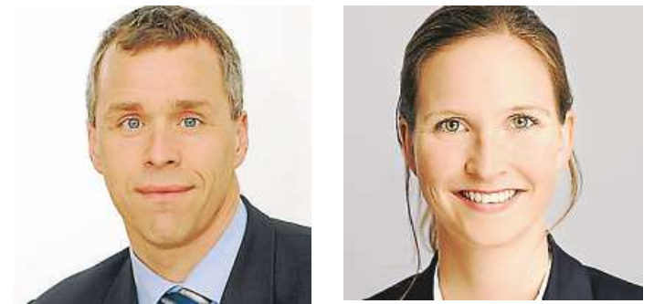
Autoren dieses Beitrags: Dr. Bernhard Becker , Oldenburg, Partner und Gesellschafter der comes Unternehmensberatung; Ronja Bauer , Hamburg, comes Unternehmensberatung, www.comes.de.

Mit Erstellung des Finanzplans stellt sich die Frage nach der weiteren Überlebensfähigkeit des Unternehmens, auch über den Betrachtungszeitraum von drei Monaten hinaus. Die Fortbestehensprognose gibt Aufschluss da-