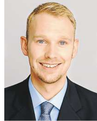
AUTOREN DES BEITRAGS

Die Vorstellung einiger mittelständischer Unternehmer, dass Frauen in kaufmännischen Positionen besser aufgehoben sind als z.B. in handwerklichen oder produk-