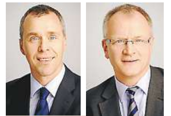
AUTOREN DES BEITRAGS

Es bleibt in den nächsten Monaten abzuwarten, welche Reaktionen dieser Preisverfall haben wird. In einem ersten Schritt dürfte das Investitionsverhalten der Branche weiter sinken. Versuche der Politik, mit weiteren Zuschüssen oder steuerlichen Erleichterungen den Milchviehbetrieben zu helfen, sind auf den ersten Blick lobenswert. Das Verbürgen weiterer Kredite durch den Bund entbindet den Landwirt aber nicht von der Rückzahlung dieser zu-